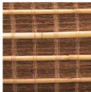
Tejido Junco/Maíz marrón Ref. 149725