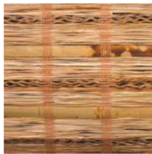
Tejido Bambú Tigrado/Maíz/ Algas Ref. 149705