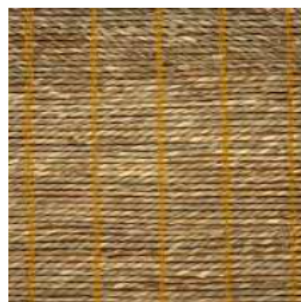
Tejido cordel Seagrass Ref. 149760