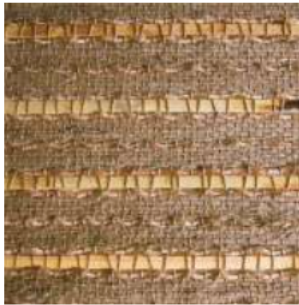
Tejido Yute/Bambú/Algas ondas Ref. 149700