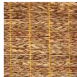
Tejido Trenza Seagrass Ref. 149755