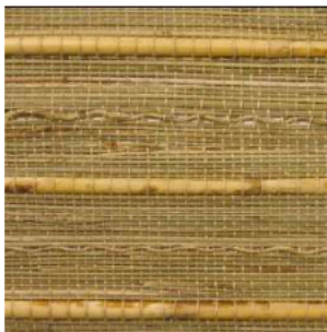
Tejido Junco/Algas/Maíz ondas Ref. 149720