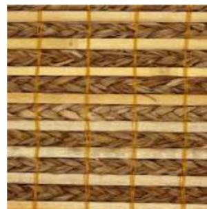
Tejido trenza Seagrass/Bambú plano Ref. 149750