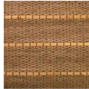
Tejido Yute/Bambú Ref. 149715