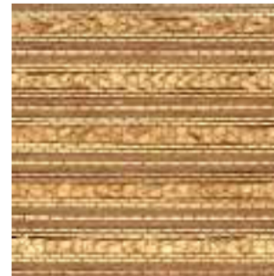
Tejido Trenza Rafia/Yute/ Bambú Ref. 149765