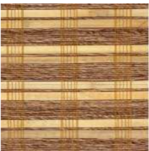
Tejido Bambú/Cordel/Maíz marrón Ref. 149745